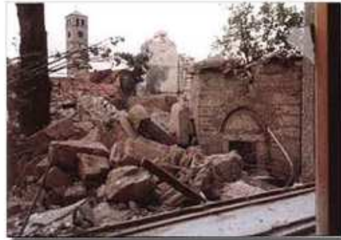
A boszniai háború idején megsemmisített Banja Luka-i Ferhád-pasa dzsámi. Ma a háború után a mecsetet felújítják

a) Milyen módokon sértették meg ezekkel a cselekményekkel a helybeli lakosság emberi és vallási jogait? Milyen módon befolyásolják az ilyen tettek a lakosság jószomszédi kapcsolatait?