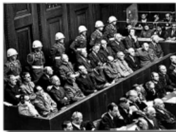
A német náci vezetők feletti ítélezés 1945-ben Nürnbergben

Emlékezzen vissza a társadalomról és az emberi jogokról tanultakra. Olvassa el az alapvető emberi jogokra vonatkozókat, és állapítsa meg, melyeket szegték meg a II. világháború alatt.