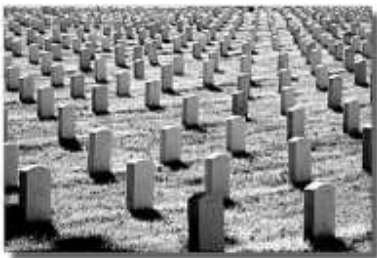
Az arlingtoni amerikai katonai temető