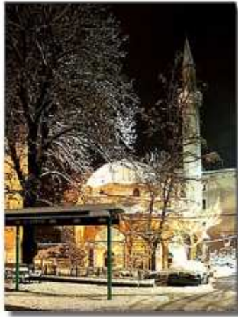
A Banja Luka-i Ferhád-pasa dzsámi