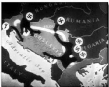
A Jugoszláv Királyság elleni 1941. évi támadás térképe