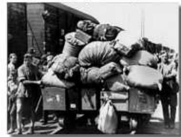
Német menekülők a háború befejezésekor