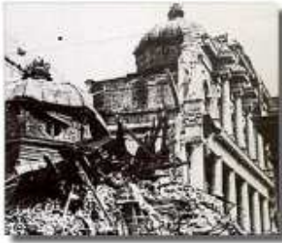
Belgrád 1941. április 6-i bombázásának következményei