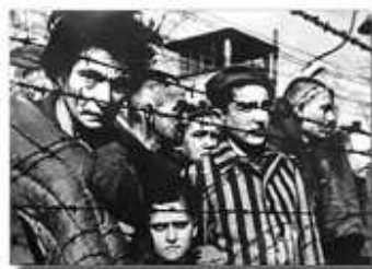
Zsidóüldözés és -gyilkolás a német Auschwitz táborban