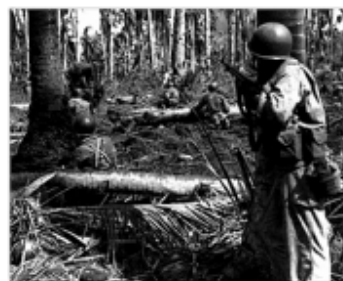
Háború a Csendes-óceán szigetvilágának őserdeiben