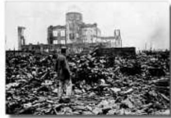
A japán Hirosimára 1945-ben ledobott nukleáris bomba következményei